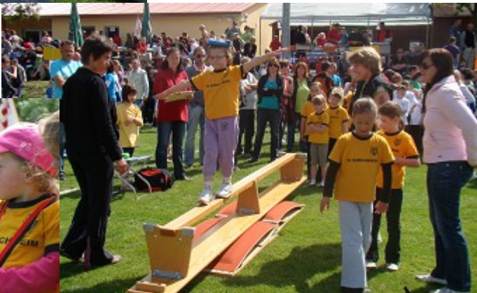
.... und ganz stolz mit Medaille