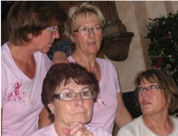
Bei der abschließenden Einkehr im Weinhof Raps in Eßfeld: