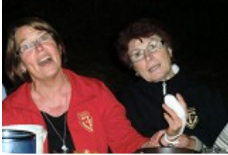
trotz Verletzung guter Dinge beim Singe' 🎵🎵🎵