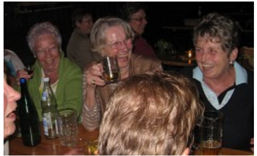
Die Sportlichsten an diesem Abend: unsere Radler