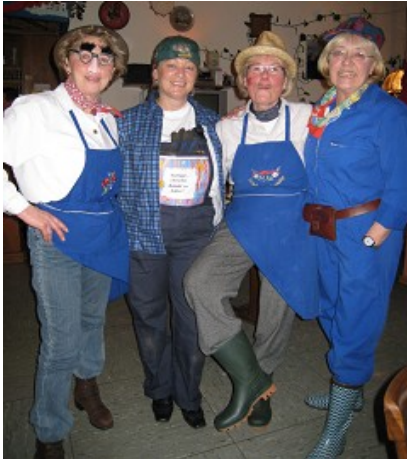
Vier fesche Jungbauern aus Südtirol waren auf Brautschau - wie man sieht erfolgreich: unser Traumpaar hier im Bild.