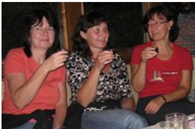
Die Vorstandschaft beim "Synchron-Trinken"